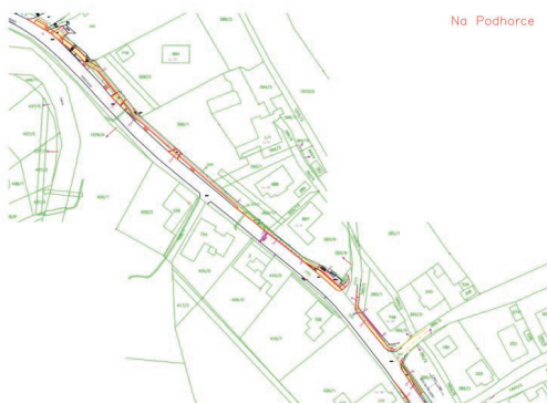
Chodník podél silnice III/01427 v obci Rybník